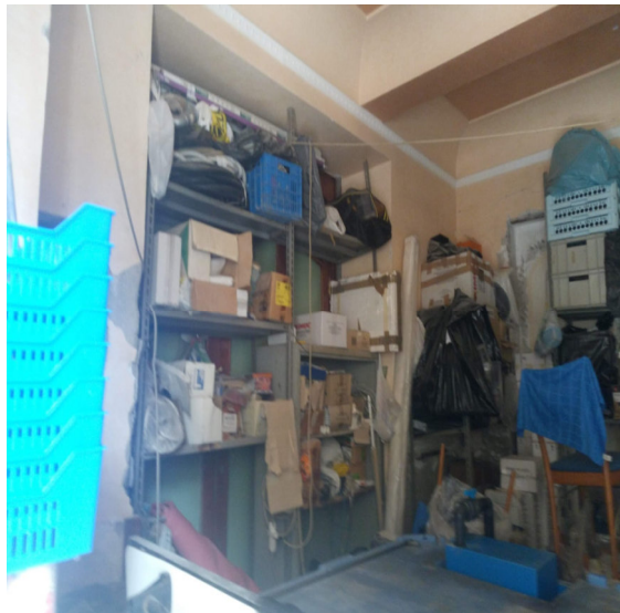
Foto N. 3 interna negozio N. 1