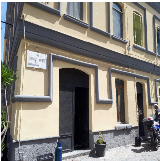
Foto N. 2 - Interna Negozio N. 1